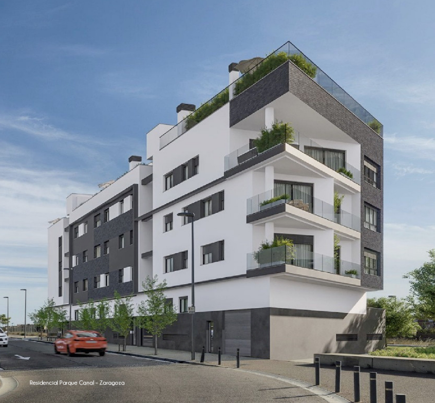
Residencial Parque Canal - Zaragoza