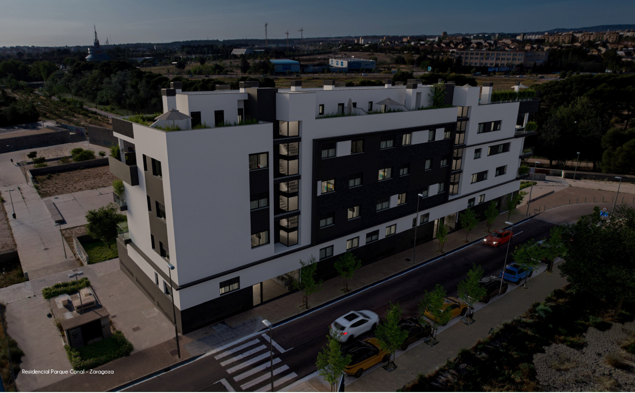
Residencial Parque Canal - Zaragoza